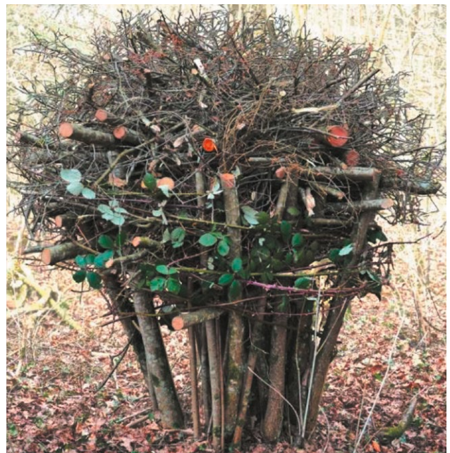
4. Nesträuber wie Katzen, Marder etc. werden durch Dornen im unteren Bereich am Hochklettern gehindert. Die Astkugel kann zusätzlich mit Laub, Gras oder Schilf abgedeckt werden.