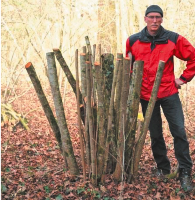
1. Den Heister auf knapp Brusthöhe absägen.

Nachstehend findet man dazu eine Kurzanleitung.