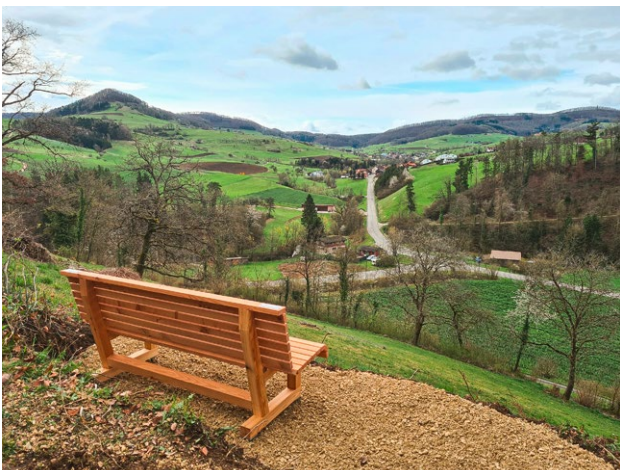
Die neue Jurapark-Sitzbank in Mettau mit Blick Richtung Laubberg und Oberhofen AG.

Dem Jurapark Aargau und dem Gemeindewerk wird herzlich für ihre Arbeit und den Einsatz zugunsten der Bevölkerung gedankt.