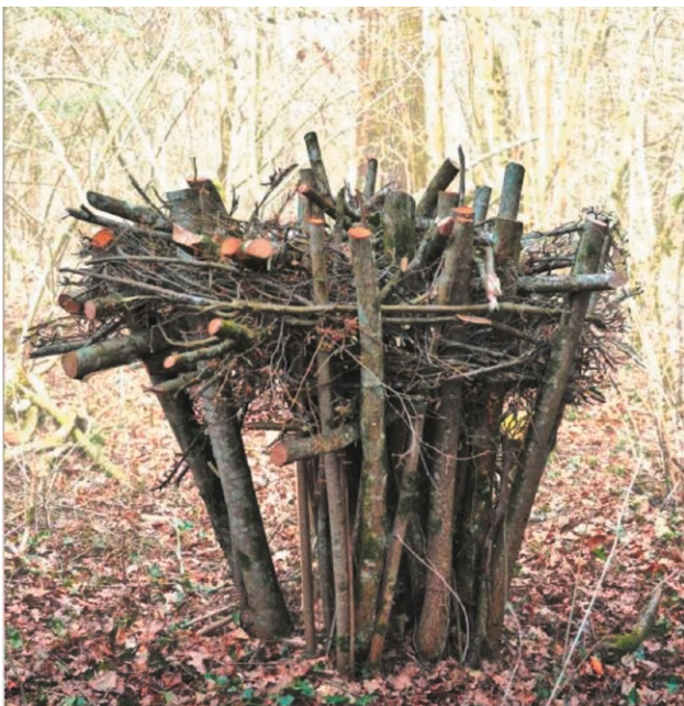
3. Auf dieser Basis wird weiteres Astmaterial eingeflochten.