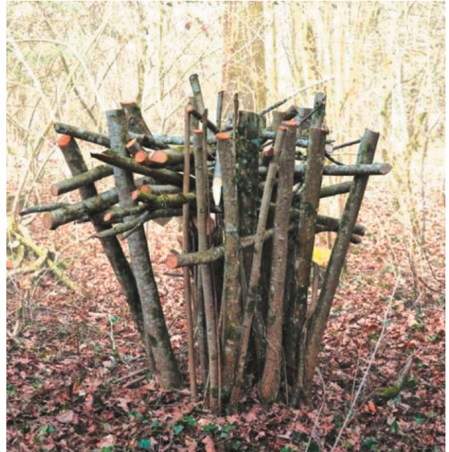
2. Die dicksten Äste werden als Tragrost eingeflochten.