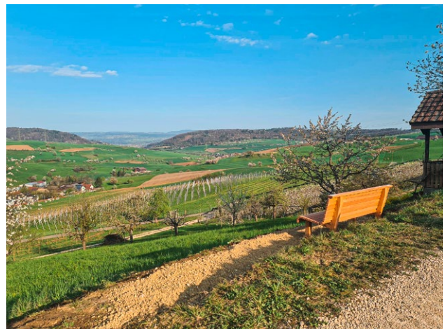
In Hottwil befindet sich die Sitzbank beim Rebberg mit herrlichem Ausblick über das Mettauertal bis zum Schwarzwald.