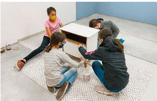
Jugendliche beim Gestalten des JUMA.

Ein toller Jugendraum ist entstanden, wo sich jeden zweiten Freitag (Datum auf der Vereinshomepage ersichtlich) Jugendliche treffen und eine gute Zeit miteinander verbringen können. Neu gibt es dort eine Tauschbibliothek, wo sich die Jugendlichen Bücher ausleihen können und auch welche bringen dürfen. Der Elternverein freut sich, weitere neue Gesichter im Jugendraum begrüßen zu dürfen. Eine Anmeldung ist dafür nicht nötig.